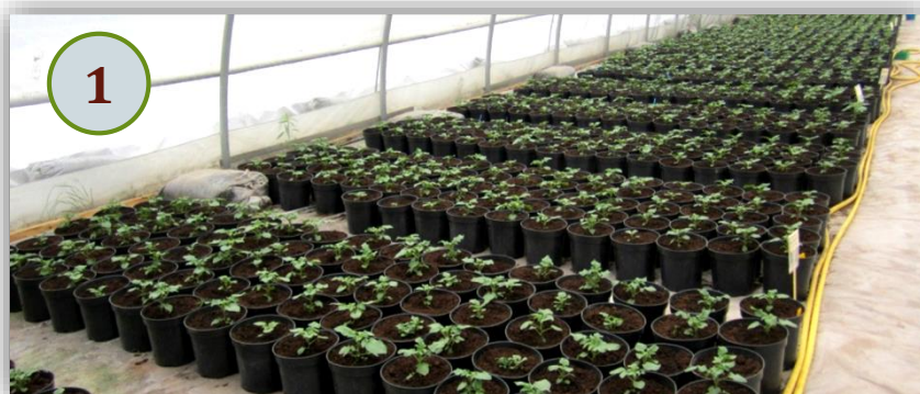
1. Укоренение растений через неделю после высадки