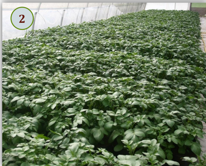
2. Бутонизация высаженных растений, 40-й день