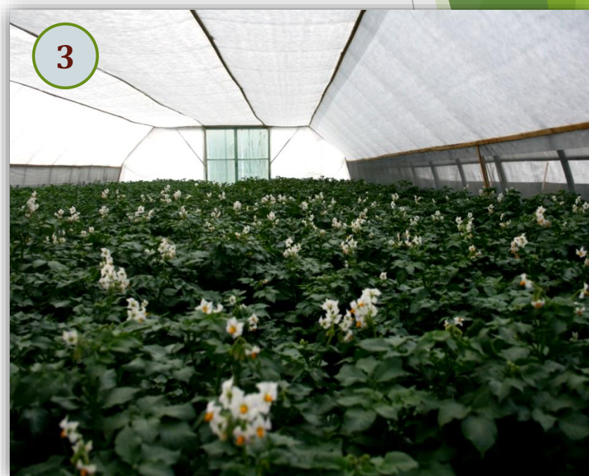
3. Цветение растений, 45-50-й день